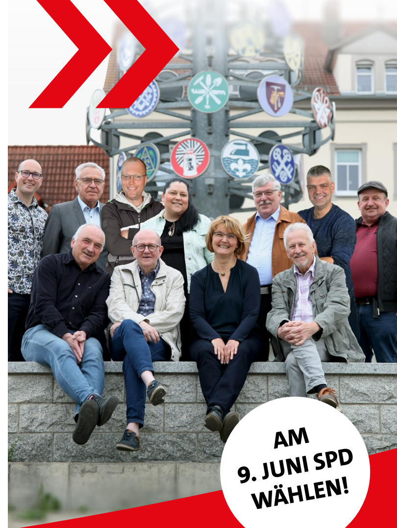
HERAUSGEBER: SPD-LANDESVERBAND SACHSEN - DEVRIENTSTRASSE 7 - 01067 DRESDEN

SPD-ORTSVEREIN RIESA & UMGEBUNG WWW.SP-D-RIESA.DE